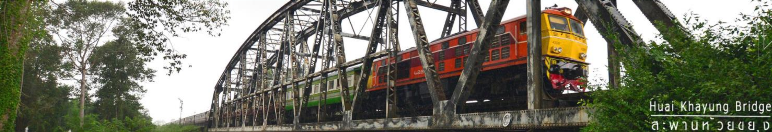
Huai Khayung Bridge สะพานห้วยขยง

การรถไฟแห่งประเทศไทยจัดตั้งขึ้นตามพระราชบัญญัติการรถไฟแห่งประเทศไทย พ.ศ. ๒๔๙๔ เป็นหน่วยงานรัฐวิสาหกิจในสังกัดกระทรวงคมนาคม มีหน้าที่ดูแลและรับผิดชอบการขนส่งทางรถไฟ โดยจำแนกการบริการเชิงพาณิชย์ซึ่งมุ่งหวังกำไรจากการขนส่งสินค้าและการจัดเดินขบวนรถโดยสารระยะไกลที่มีคุณภาพ เช่น ขบวนรถด่วนพิเศษ รถด่วน รถเร็ว และบริการเชิงสังคมที่เป็นบริการให้แก่ผู้มีรายได้น้อย เช่น รถชานเมือง ขบวนรถท้องถิ่น เป็นต้น